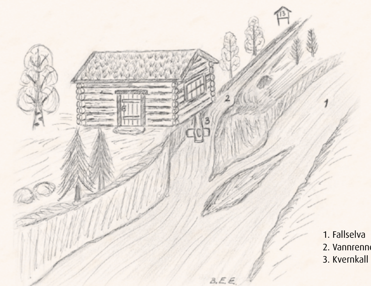
Figur 2: Slik kan det ha sett ut. Kvernhusfossen sett nedenfra, med gårdskvern under Ringstad.